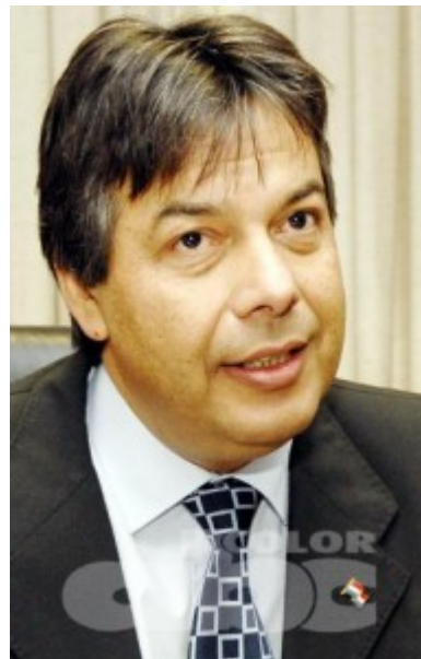
Rubén Candia Amarilla, fiscal general del Estado.

El Ministerio Público intenta hacer frente a las múltiples quejas por la falta de resolución de casos relacionados a los derechos humanos, durante y la posdictadura en nuestro país. Para el efecto, se creó una unidad especializada en la que los fiscales trabajarán con exclusividad con las 850 causas que hay en la actualidad y las que se irán presentando.